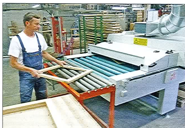
В конце транспортной ленты заготовки твердеют, проходя через ультрафиолетовую сушилку, затем их укладывают в штабеля.