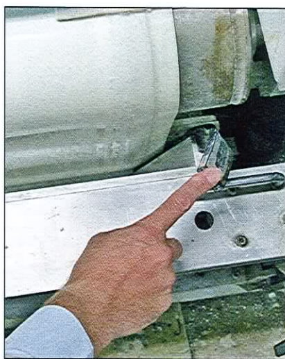
Для рекуперации лака Giardina использует два резиновых скребка, которые очень бережно удаляют остатки лака с транспортной ленты.