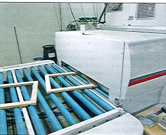
Заготовки после окрашивания и перед обработкой в микроволновой сушилке

Микроволновое излучение заставляет молекулы воды в лаке колебаться. Из-за трения друг о друга они нагреваются и испаряются. Таким образом, внутри «MOS» лак теряет до 40% содержащейся в нем воды. Из-за того, что колебанию подвергаются главным образом молекулы воды, предотвращается нагрев основания. Волны также обладают проникающим действием, которое распространяется на самые нижние слои лака