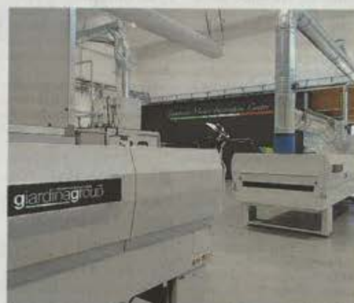
Il "Giampiero Mauri Innovation Centre"