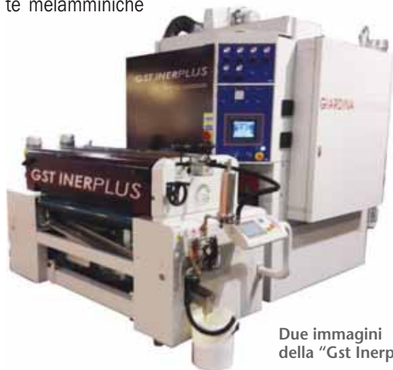
Due immagini della “Gst Inerplus”.

In primo piano la tecnologia “ Gst Inerplus ”, un ciclo di applicazione ed essiccazione Uv che permette di ottenere superfici di ottima qualità, soprattutto “High Gloss”, su materiali “tradizionali” nobilitati con carte melamminiche