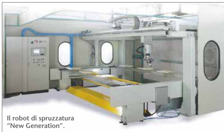
Il robot di spruzzatura "New Generation".

"Avremo il piacere l'opportunità di dimostrare concretamente quanto stiamo crescendo, gli ultimi sviluppi tecnologici nei quali crediamo, di testimoniare la volontà di proporci come partner globali, capaci di dire la propria con tecnologie e metodi di applicazione diversi. Nonostante la stagione economica mondiale non sia ancora quella che vorremmo, per noi è un buon momento", conclude Giampiero Mauri. "Abbiamo installato alcuni importanti impianti e altri sono in fase di progettazione o di collaudo. Il nostro fatturato oramai ha raggiunto i 15 milioni di euro e ci attendiamo che nel 2015 cresca ulteriormente, perché