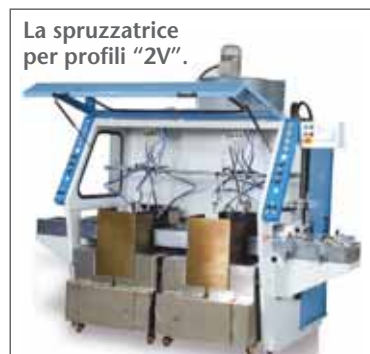
La spruzzatrice per profili "2V".

Da oltre dieci anni ha sviluppato soluzioni di spruzzatura robotizzata per la verniciatura di piccoli lotti, "customer order", anticipando di alcuni anni le esigenze di un mercato sempre più orientato al "just in time", al su misura, alla personalizzazione più spinta, alla gestione efficace ed efficiente di lotti sempre più piccoli. ■